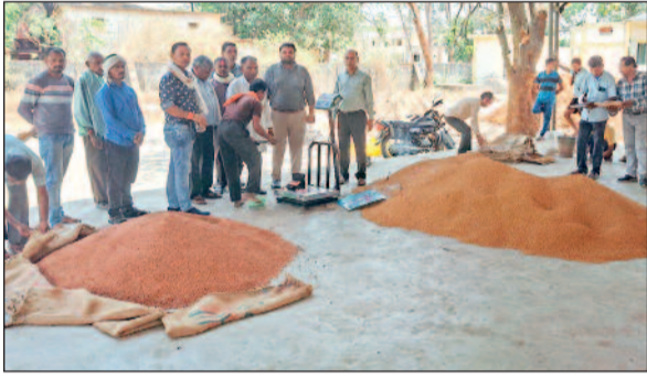
हरिभूमि न्यूज ►►नगरी

कृषि उपज मंडी प्रांगण नगरी में चना फसल की खरीदी हुई। इस दिन 100.50 क्विंटल चने की खरीदी की गई जिससे 24 किसानों ने मंडी लाभ प्राप्त किया।