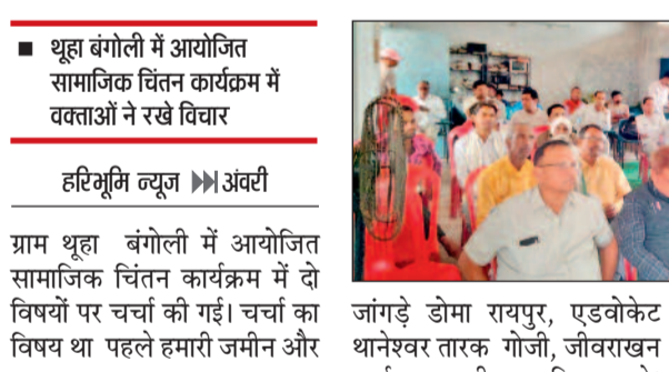
हमें समझना होगा। हमारी जनसंख्या के अनुपात में भागीदारी होनी चाहिए। प्रतिनिधित्व का अधिकार होना चाहिए जो संविधान में निहित है लेकिन वास्तविक रूप से एससी-एसटी-ओबीसी समाज हक से वंचित है। उन्होंने कहा कि शिक्षा से ही जागरूकता आ सकती है। समस्त निजी विद्यालयों, महाविद्यालयों