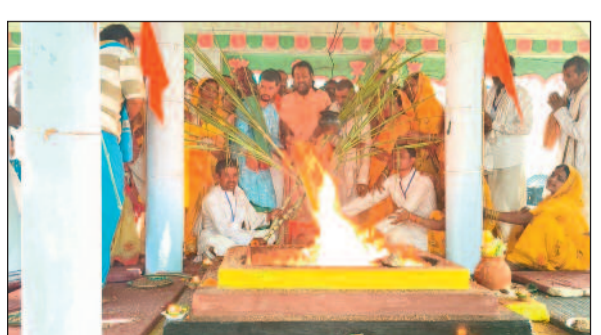
वाराणसी से अनेक साधु-संतों का आगमन हुआ। संतों के आगमन से यज्ञ स्थल की आध्यात्मिक गरिमा और अधिक बढ़ गई। महायज्ञ के अंतिम दिवस