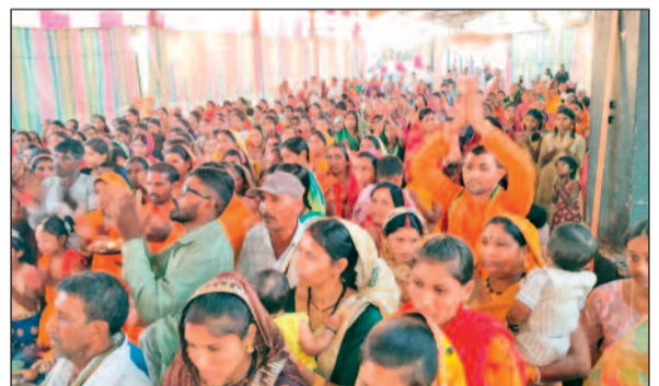
कथा पहलाद चरित्र, गजेंद्र मोक्ष, समुद्र मंथन एवं वमन अवतार, पंचम दिवस मत्स्य अवतार, श्री राम जन्म एवं श्रीकृष्ण जन्म की कथा हुई। षष्ठम दिवस बाल लीला, माखन चोरी, दही लूट एवं गोवर्धन पूजा, सप्तम दिवस रामलीला श्री कृष्णा मथुरा गमन गंज वध एवं