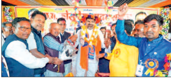
हरिभूमि न्यूज ►►जीजामगांव

छग कोसरिया यादव समाज कुरुद क्षेत्र का वार्षिक अधिवेशन, आदर्श विवाह महिला सम्मान, प्रतिभावान छात्र-छात्राओं का सम्मान नगर पंचायत भखारा के मिनी स्टेडियम में हुआ।